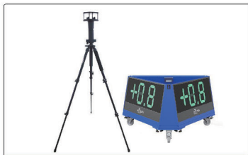
超声风速测量显示系统