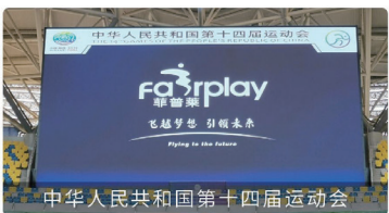
中华人民共和国第十四届运动会