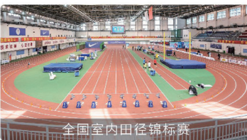
全国室内田径锦标赛