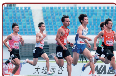
广东省U系列田径联赛