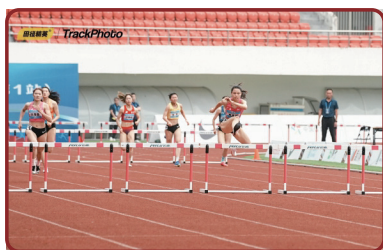
全国田径大奖赛（肇庆站）