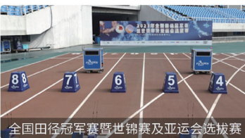
全国田径冠军赛暨世锦赛及亚运会选拔赛