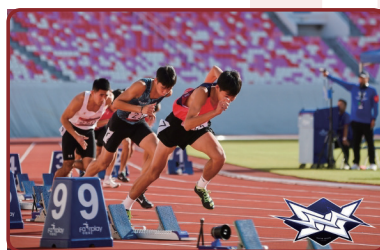
苏炳添速度挑战赛系列活动