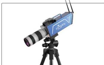
彩色无线便携式电动计时仪