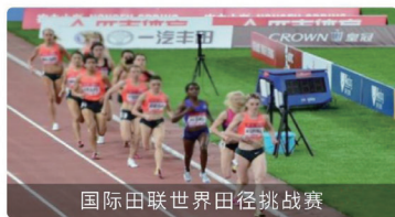
国际田联世界田径挑战赛