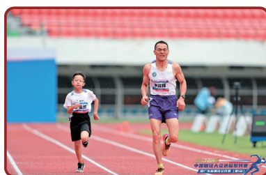
广东省田径公开赛