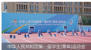
中华人民共和国第一届学生(青年)运动会