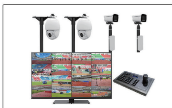
竞赛仲裁智判系统