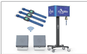
径赛长跑计圈系统